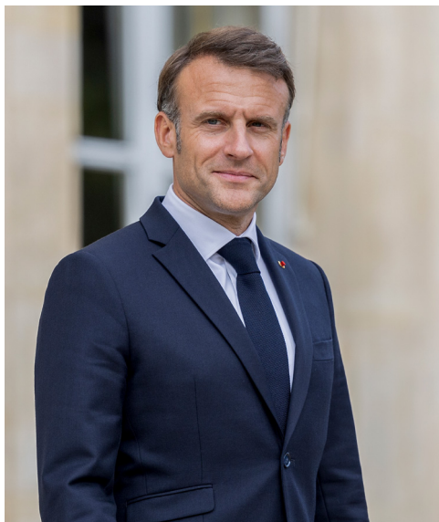
Emmanuel Macron Président de la République

« Le moment que j'ai souhaité sur le site d'Imerys, à Echassières, s'inscrit dans l'ambition de réindustrialisation poursuivie depuis 2017. Nous avons en effet mené la bataille de l'attractivité, de l'innovation et de l'emploi, avec des résultats historiques en la matière. Nous avons fait beaucoup mais l'heure exige la mobilisation et l'accélération. En effet, nous traversons un moment de grandes bascules, géopolitiques et technologiques, qui s'ajoutent à nos grandes transitions du siècle, le climat, la démographie, le numérique. La question posée à la Nation comme à l'Europe est celle de son indépendance : industrielle, technologique, agricole, culturelle. Il nous faut retrouver les moyens de rebâtir cette indépendance, vis à vis de grands compétiteurs qui s'extraitent des règles du jeu, et face à des ruptures irrémédiables dans notre paysage commun. En quelques années, le monde s'est profondément transformé. Plus que jamais, nos dépendances se paieront au prix cher.